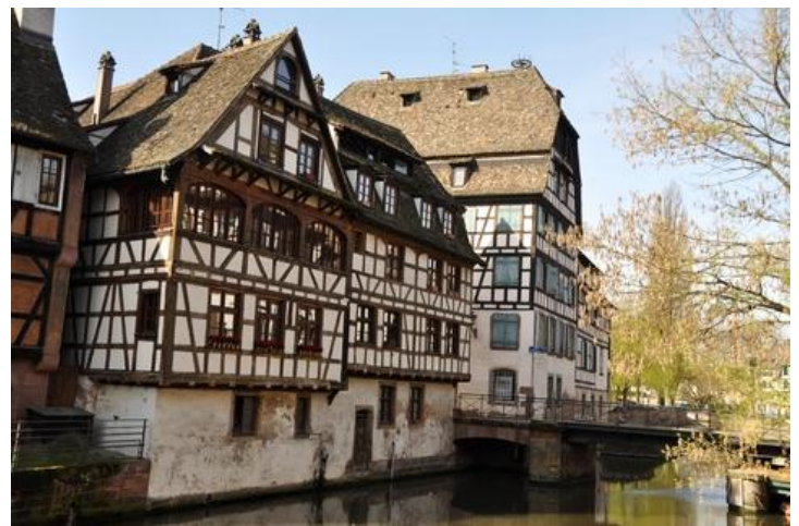
Pitoreska och typiska korsvirkeshus från Alsace